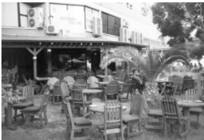
Nyugalom és pálmafák: polgári lét mindenkinek

indulnak) visz a mintegy hetven kilométernyire fekvő Limassolba, házhoz, egész barátságos áron.