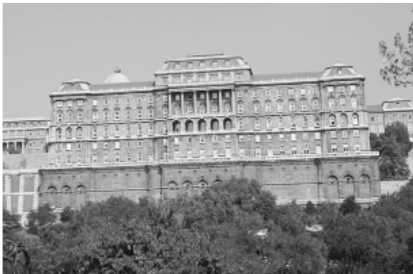
Most éppen zárva tart a Nemzeti Könyvtár

általában jól meglepi a „szakembereket”. Ilyenkor jön a bulvárízű siránkozás „Tél-tábornokról”, meg „üvegházhatásról”. Szóval kicsit így vannak a budapesti könyvtárak is: rendszerben, az Országgyűlési zárjon be, az Akadémiai is pihenjen, az Egyetemi meg akár évközbelen is zárva lehetne, a változást úgysem