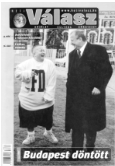
Veszélyben a polgári sajtó?

Mára Magyarországon kialakult egy – ha még nem is tehető – polgári réteg, amely kiköveteli a maga igényeinek teljesítését. Itt van a fiatalosság, amely már nem hagyja magát manipulálni. Ráadásul rengeteg helyen képeznek újságírót, akik előbb-utóbb tehetségük, rátermettségük révén bekerülnek a sajtó vérkeringésébe. Gondoljunk el, 90-ben mennyire más volt a helyzet! Tudom, hogy a közeljövőben meg kell a nadrágszíjat húzni a polgári újságíróknak, de ez átmeneti idő lesz. Persze a nehézségeket úgy könnyebb átvészelni, ha a baloldal által megvetett sajtómunkás maga mögött érzi a polgári tábor támogatását, rokonszenvét. – J. G.