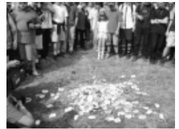
Kicsit szomorkás... (tüntetés a kedvezményekért)

Az internetet intenzíven használók számára a telefonos elérés alternatívái lehetnek a szélessávú hozzáférések. Itthon a kábelnet és az ADSL a legelterjedtebbek, sajnos csak nagyobb településeken, illetve Budapest bizonyos kerületeiben érhetőek el. Ezek a szolgáltatások jóval nagyobb sebességet és állandó hálózati kapcsolatot kínálnak és nem járnak külön távközlési költséggel (azaz, míg egy modemes elérés esetén az internetelés és a telefondíj is kiadást jelent, itt csak az előbbiért kell fizetni), de vi-